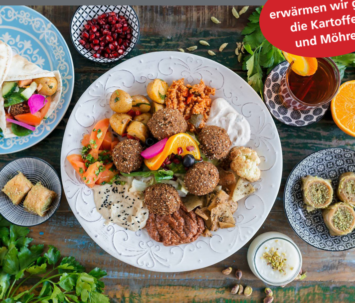
Falafelteller (Die Vorspeisen variieren)

Auf Wunsch erwärmen wir gerne die Kartoffeln und Möhren.